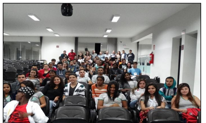
Oficina de Trabalho do Parlamento Jovem / 2017