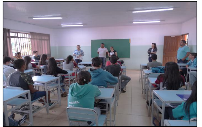
Mobilização do Parlamento Jovem / 2017 – E. E. Francisco do Carmo