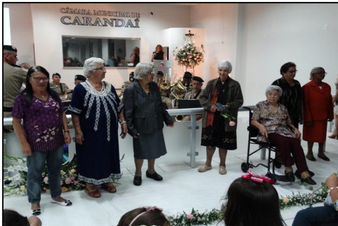
Comemoração ao Dia Internacional da Mulher