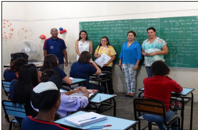
Mobilização do Parlamento Jovem / 2017 – E. E. Prof. Gentil Pereira Lima