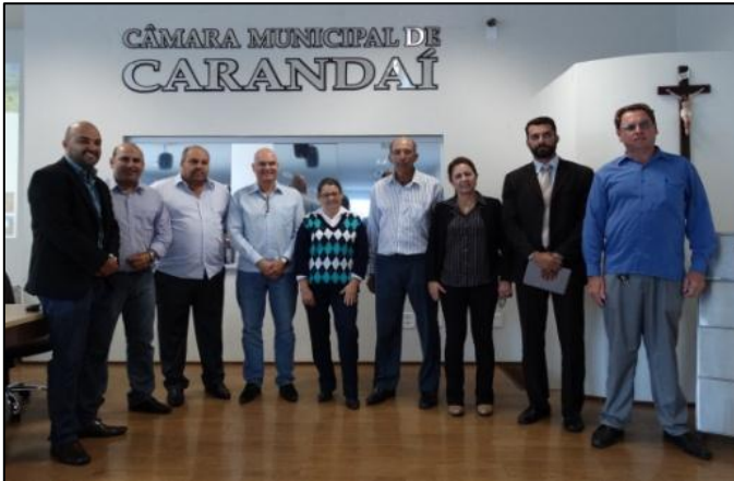
AMM em Ação – Curso: Poder Legislativo e Marco Regulatório