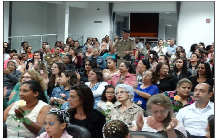
Comemoração ao Dia Internacional da Mulher