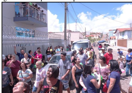
Manifestação do Sindicato dos Servidores Públicos