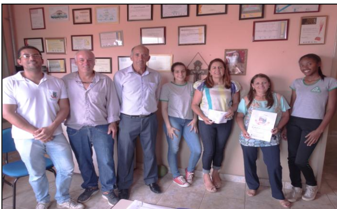
Mobilização do Parlamento Jovem / 2017 – E. E. Dep. Patrús de Sousa