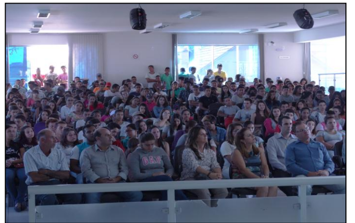
Lançamento do Parlamento Jovem / 2017 – Educação Política na Escola